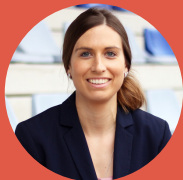
DRA. CAROLINE BECHTEL SUBDIRECTORA DEL INSTITUTO DE DERECHO DEPORTIVO EN LA UNIVERSIDAD ALEMANA DEL DEPORTE EN COLONIA