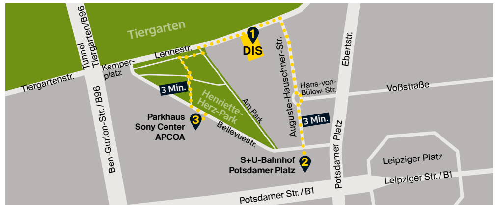
Fußwege zur DIS (1) von S+U-Bahnhof Potsdamer Platz (2) und vom APCOA-Parkhaus (3) in der Bellevuestraße 3

Nähere Informationen finden Sie über den Link → www.bvg.de .